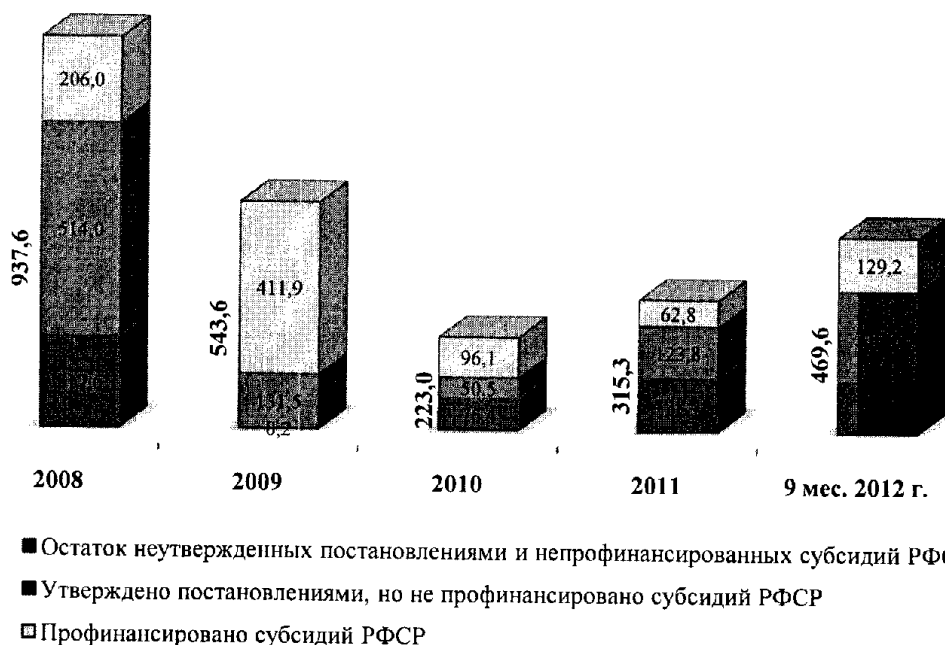
Рис. 1. Анализ финансирования субсидий из РФСР городу Березники с 2008 по 2012 годы, млн. руб.

г. Березники - не предусматривались субсидии из РФСР на инвестпроекты.