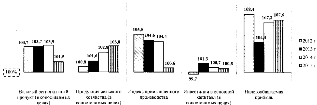
Рис. 1. Прогноз динамики основных макроэкономических показателей развития Пермского края (в % к соответствующему периоду предыдущего года).

Следует отметить, что в Прогнозе на 2013 год - уменьшена прогнозная оценка индекса промышленного производства - с 105,2% до 104,6%, темпов роста продукции сельского хозяйства - с 102,6% до 101,6%, сокращены темпы роста налогооблагаемой прибыли - с 116,1% до 104,3%, инвестиций - с 102% до 101%.