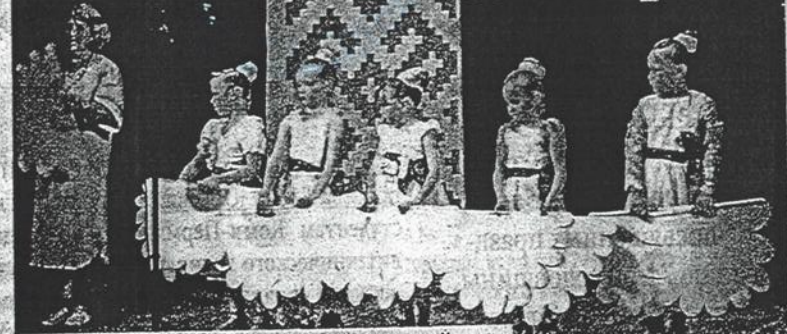
Детский фестиваль, посвященный 95-летию Кудымкарского района, прошел в районном Доме культуры